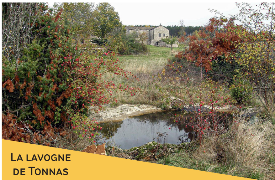
LA LAVOGNE DE TONNAS