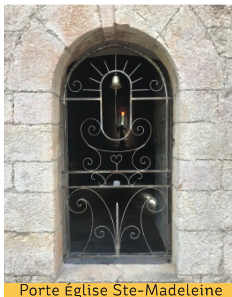
Porte Église Ste-Madeleine