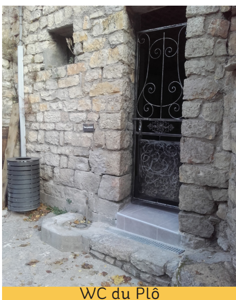
WC du Plô

Au cours de l'année, les agents techniques de la commune ont effectué plusieurs travaux. Certains d'entre vous ont dû les voir à l'œuvre. Parmi ces travaux, on peut citer la rénovation de l'entrée de l'église de Prades, l'entrée du cimetière de Sainte-Enimie, le mur au-dessus de la crèche, la porte de la chapelle Ste-Madeleine, la pose du grillage au village vacances, les WC place du Plô et bien d'autres encore. Merci à eux !