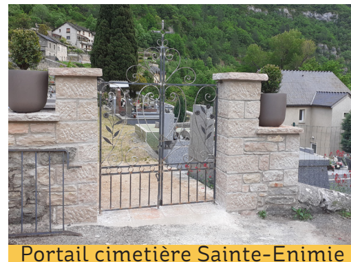
Portail cimetière Sainte-Enimie