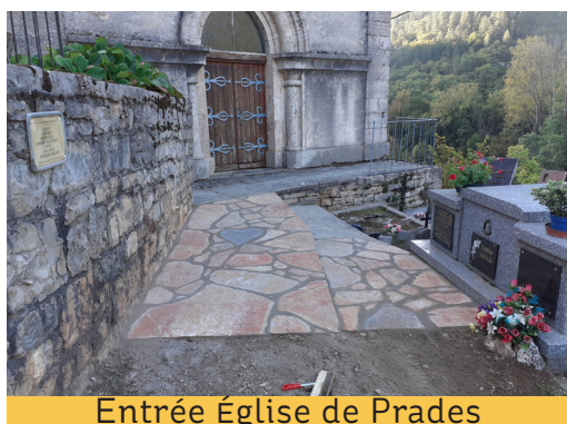
Entrée Église de Prades