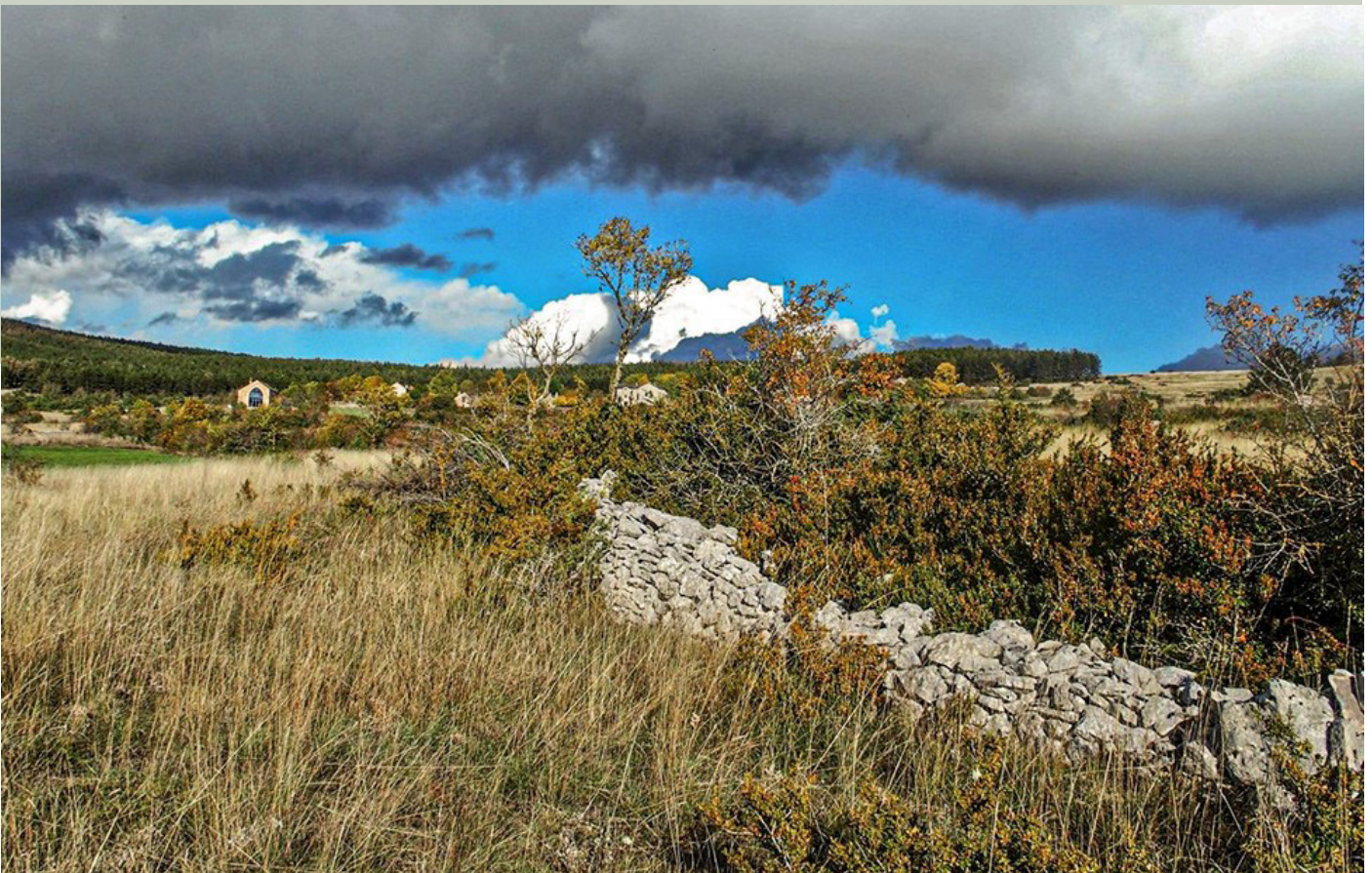
TONNAS VU DE LA STEPPE

« Une fois, après une journée de labeur, mon grand-père après avoir bâté sa mule (à mon avis trop chargée), elle s'est assise à mi chemin du parcours sur les pattes arrières. Voyant cela, il a tiré sur la corde pour la redresser en vain. À un moment donné, en essayant de se lever, la mule a cabussé en arrière en se rompant les reins. Obligé de l'abattre, il ne s'en est jamais remis. Depuis ce jour-là, c'est lui qui faisait office de mule, on le voyait rentrer le soir chargé comme une mule si l'on peut dire, la tête noyée dans un sac de foin».