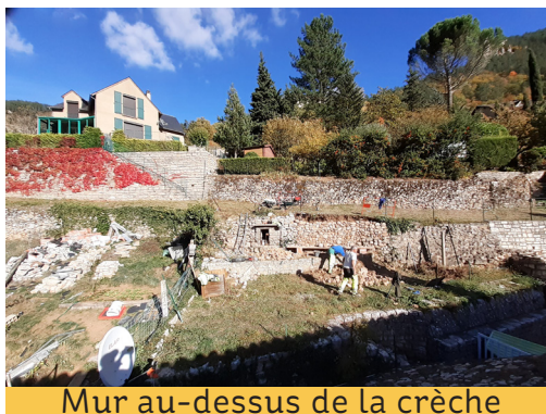
Mur au-dessus de la crèche