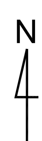
PLANCHE 3 ECHELLE 1/5000