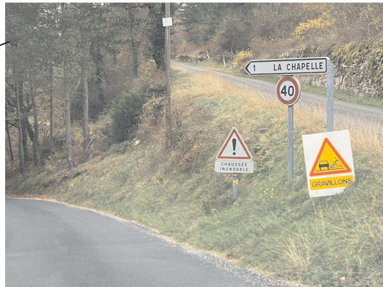
Goudronnage route de la Chapelle