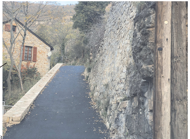
Rue du Pigeonnier (Sainte-Enimie)