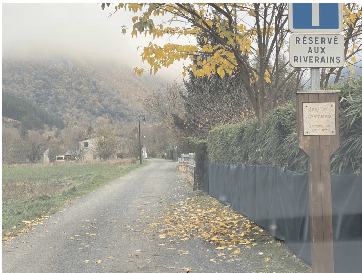
Impasse des Castanets (Quézac)