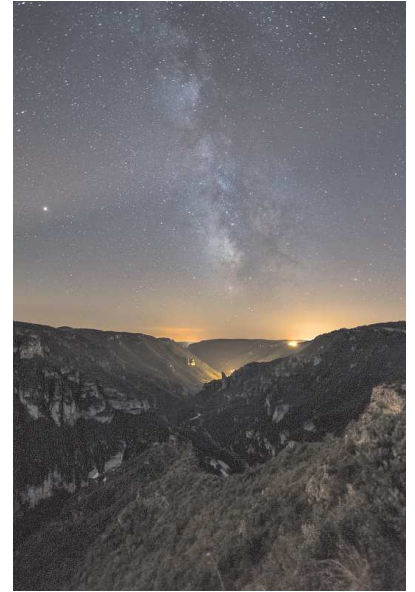
les Détroits.

Comme vous le savez, la commune Gorges du Tarn Causses s'est lancée dans un programme de modernisation de l'éclairage public, les secteurs de Quézac et Montbrun ont été réalisés ces dernières années, le secteur de la commune déléguée de Sainte-Enimie va suivre en 2021 avec le changement d'une majeure partie des matériels et candélabres. Des coupures sont prévues de 23h à 7h dans les villages, les horaires seront adaptés aux contraintes touristiques durant la saison estivale dans les villages les plus fréquentés qui verront une diminution d'intensité l'été et des coupures le reste de l'année. Cette opération, financée en partie par des fonds de l'Union Européenne et du SDEE de la Lozère, permettra des économies d'énergie, mais aussi d'apporter notre concours au Label de réserve internationale de Ciel Etoilé, récemment décerné au territoire. Cette démarche, portée par le Parc National des Cévennes, valorise le ciel nocturne en supprimant les pollutions lumineuses, pour des observations encore plus exceptionnelles. Deux réunions publiques ont eu lieu à Quézac et Blajoux pour présenter ce projet et une aurait dû avoir lieu à Sainte-Enimie au printemps mais la situation sanitaire ne nous a pas permis de réaliser cette rencontre.